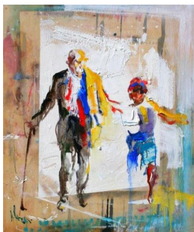
Peinture : Diego Ramos