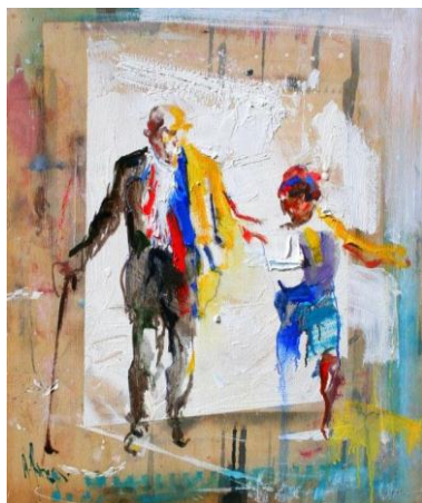
Peinture : Diego Ramos